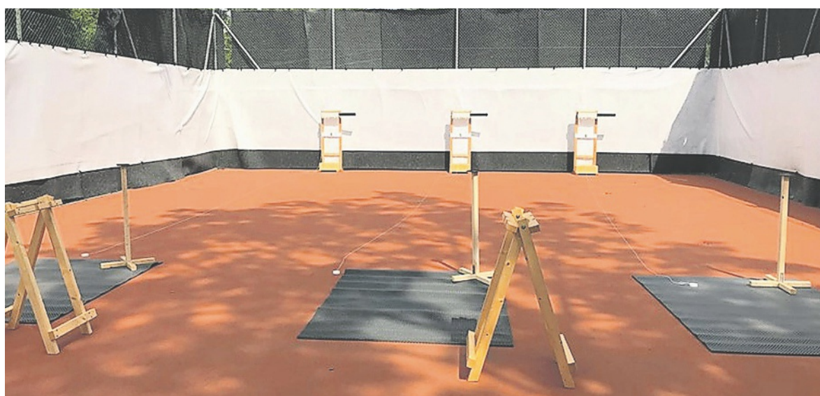
Target-Sprint-Anlage im Sportzentrum Kerenzerberg, Filzbach.

für Target Sprint zur Verfügung stehen. Damit würde das erste Trainingscenter für Target Sprint im Zürcher Unterland Realität.