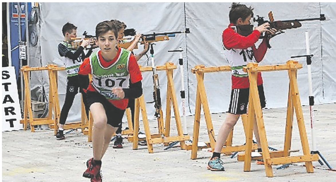
Target Sprint – eine spannende Kombination aus Schiess- und Laufsport.

Die Sportschützen Glattfelden, die für ihre hervorragende Jugendarbeit bekannt sind, haben den Faden nun ebenfalls aufgenommen und möchten diese neue Disziplin fördern. Voraussichtlich ab Sommer 2022 soll bei uns ein Trainingscenter